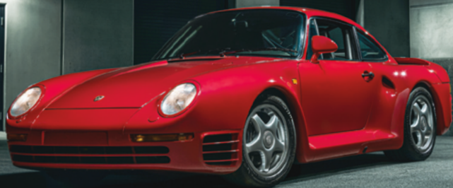
1988 Porsche 959 S Recently Sold by Broad Arrow Private Sales

broadarrow au ctions.com | broadarrow priv atesales.com broadarrow cap ital.com